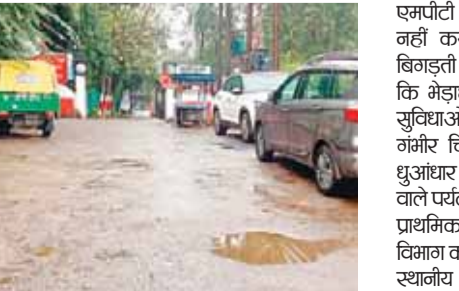
कहीं न कहीं विभाग की कर्मचारियों की मिलीभगत का परिणाम भी हो सकती है। बताया जा रहा है कि

भेड़ाघाट। विश्वप्रसिद्ध संगमरमर की वादियों को देखने देश-विदेश से आने वाले पर्यटक इन दिनों एमपीटी (मध्य प्रदेश पर्यटन) गेट पर अवैध वाहनों की भीड़ के कारण भारी परेशानी का सामना कर रहे हैं। पंचवटी स्थित एमपीटी परिसर में पर्यटन विभाग द्वारा ठहरने और भोजन की व्यवस्था तो की गई है, लेकिन कर्मचारियों की लापरवाही के चलते गेट पर अनियमित पार्किंग और अव्यवस्था बनी रहती है। पर्यटकों का कहना है कि अवैध रूप से खड़े वाहनों से आने-जाने में बाधा उत्पन्न होती है, जिससे कई बार जाम जैसी स्थिति बन जाती है। करोड़ों रुपये खर्च करने के बावजूद विभाग पर्यटकों को कुलभूत सुविधाएं उपलब्ध कराने में विफल नजर आ रहा है। सूत्रों के अनुसार, गेट पर फैली यह अव्यवस्था